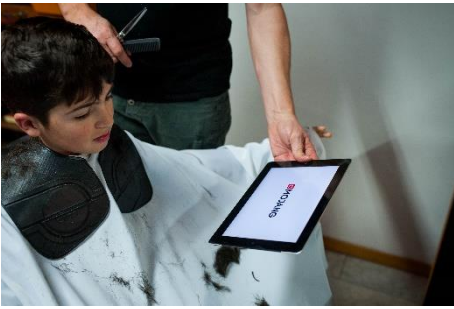
Du kannst deinen Ipad brauchen.