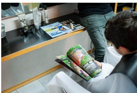
Du kannst Zeitschriften anschauen.