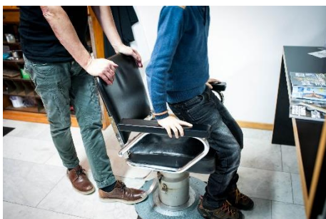
In den Stuhl sitzen.