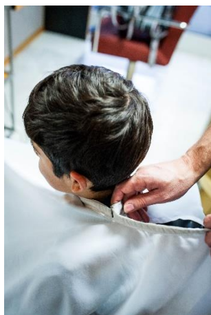
Der Umhang wird geschlossen.