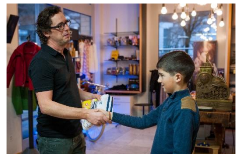
Du verabschiedest dich.