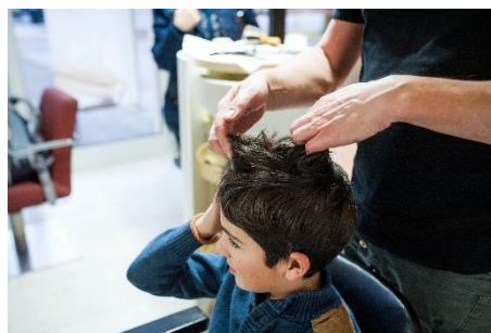
Der Coiffeur fasst die Haare an.