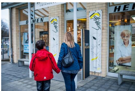
Zum Coiffeursalون gehen.