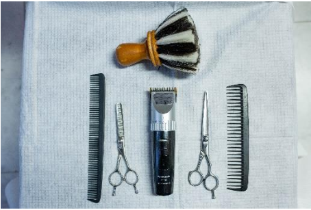
Der Coiffeur benutzt verschiedene Dinge: - Scheren - Kamm - Rasierer - Pinsel