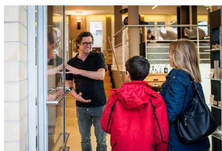
In den Salon hineingehen, den Coiffeur treffen.