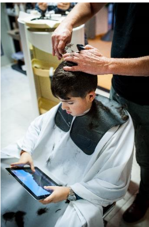
Er schneidet mit der Schere.