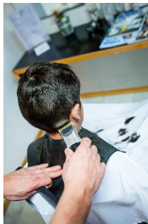
Er schneidet mit dem Rasierer.