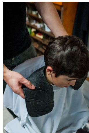
Der Haarschutz wird umgelegt.