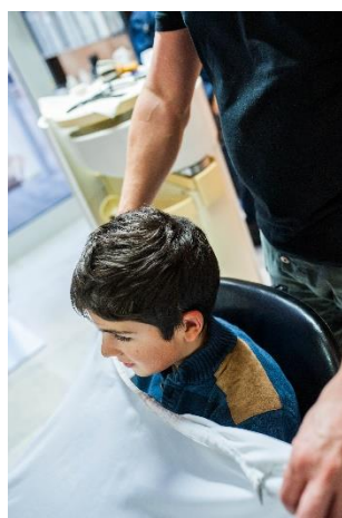
Der Umhang wird umgelegt.