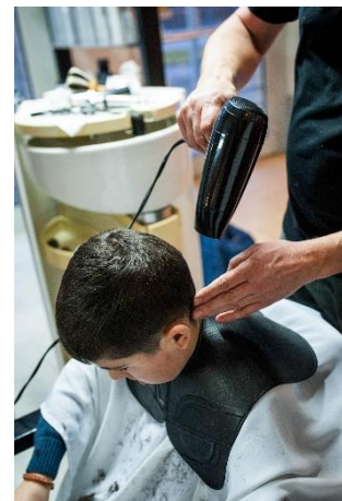
Er föhnt die Haare.