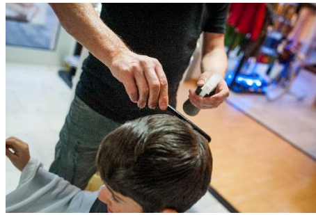
Der Coiffeur spritzt Wasser auf den Kamm.