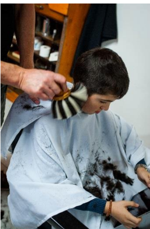
Er wischt die Haare weg.